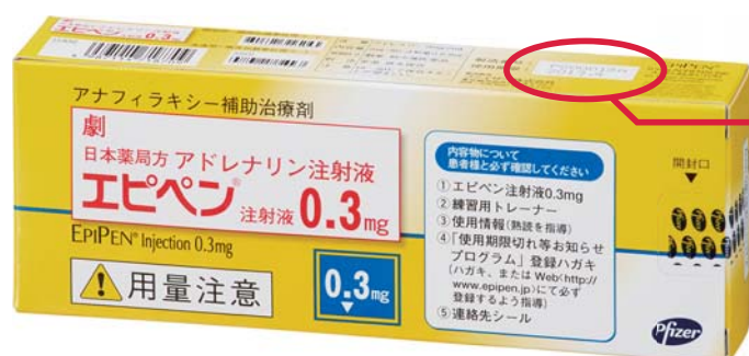
エピペン®注射液0.3mgの外箱