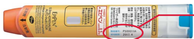
エピペン®注射液0.3mgの本体