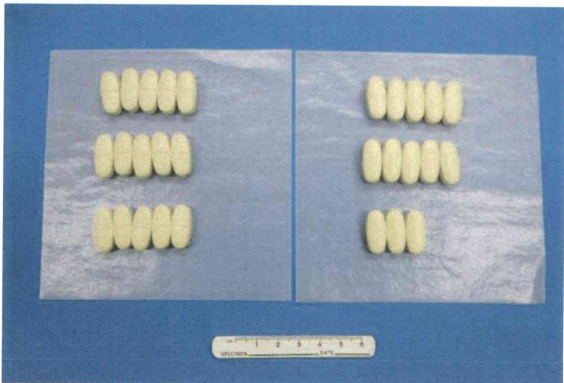
中に入っていた錠剤を薬包紙に並べた様子 (28錠入り)